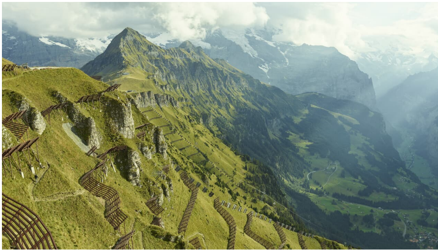
Jungfrauabnahmen Management AG