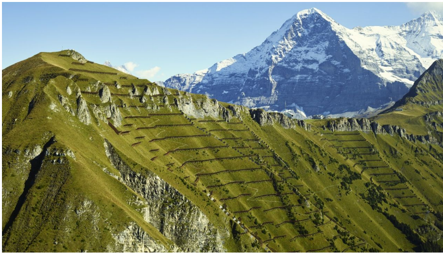
Jungfrauabahren Management AG