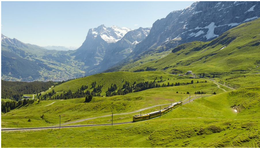
Jungfrauabnahmen Management AG