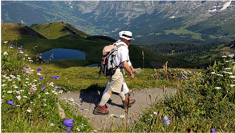
Jungfrauabnahmen Management AG