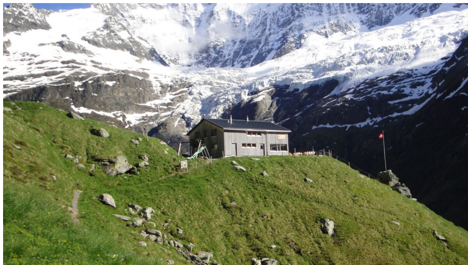
MA PM Grindelwald, Grindelwald Tourismus