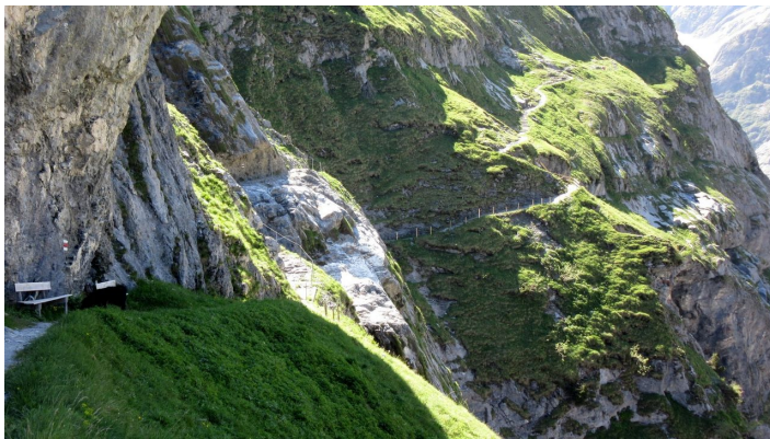
MA PM Grindelwald, Grindelwald Tourismus