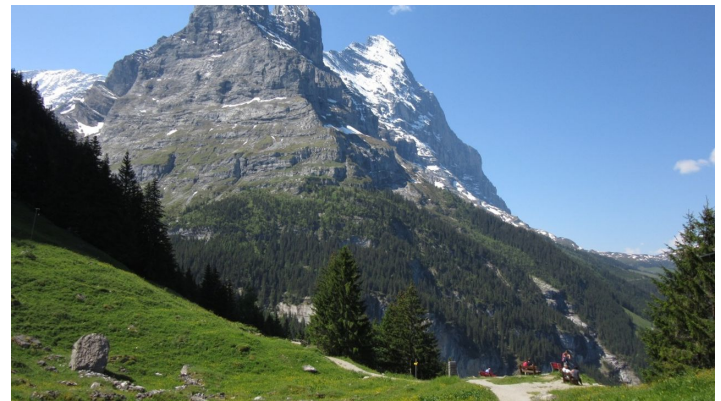
MA PM Grindelwald, Grindelwald Tourismus