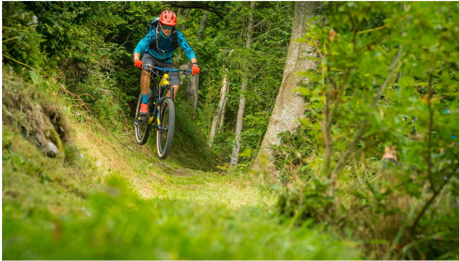
Rasante Abfahrten durch grüne Landschaften