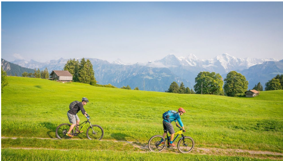
Aussichtsreiche Tour