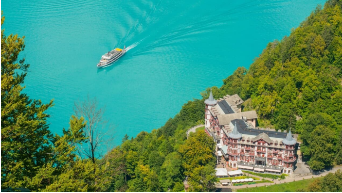
Melanie Studer, Interlaken Tourismus