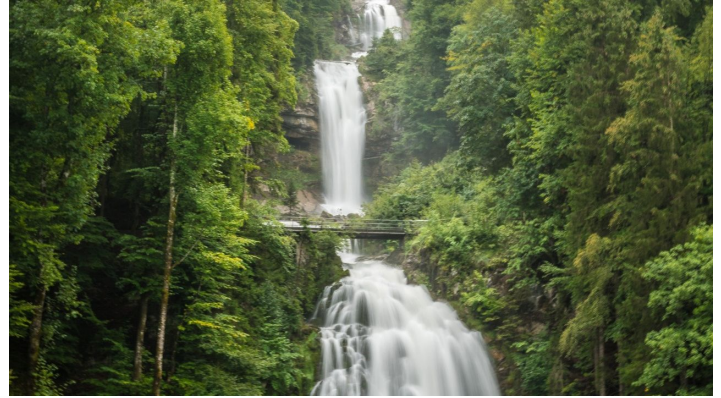
Melanie Studer, Interlaken Tourismus