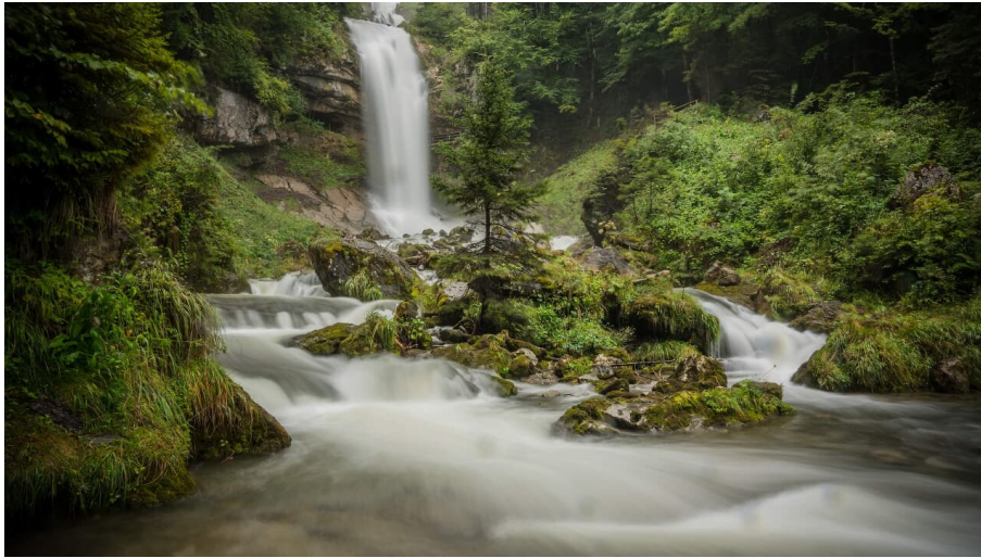
Melanie Studer, Interlaken Tourismus