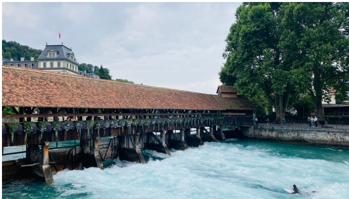
Markus Schluep, Berner Wanderwege