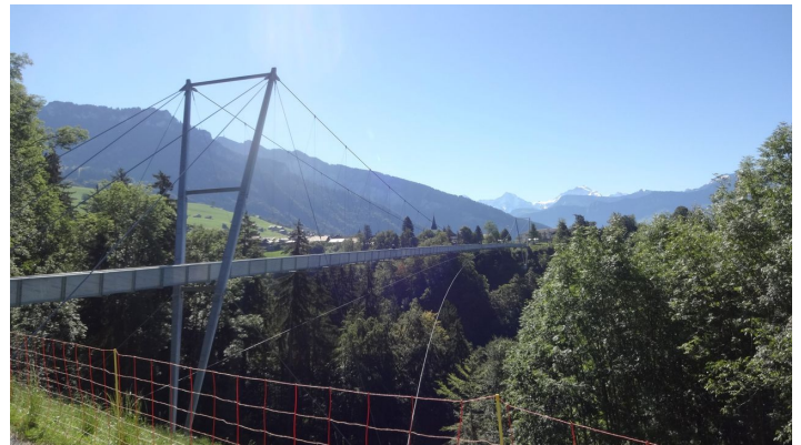
HB Sigriswil