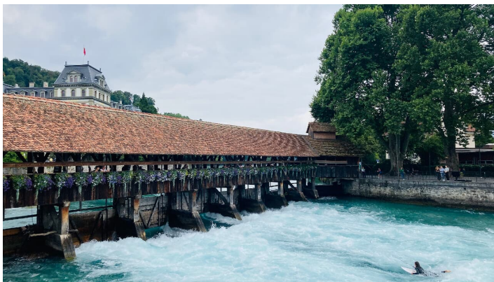
Markus Schluep, Berner Wanderwege