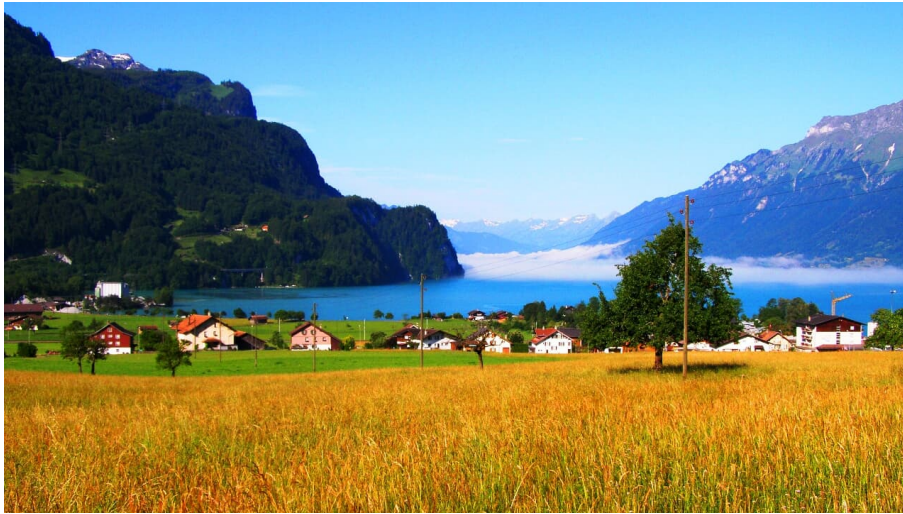
Brienzsee von Kienholz aus