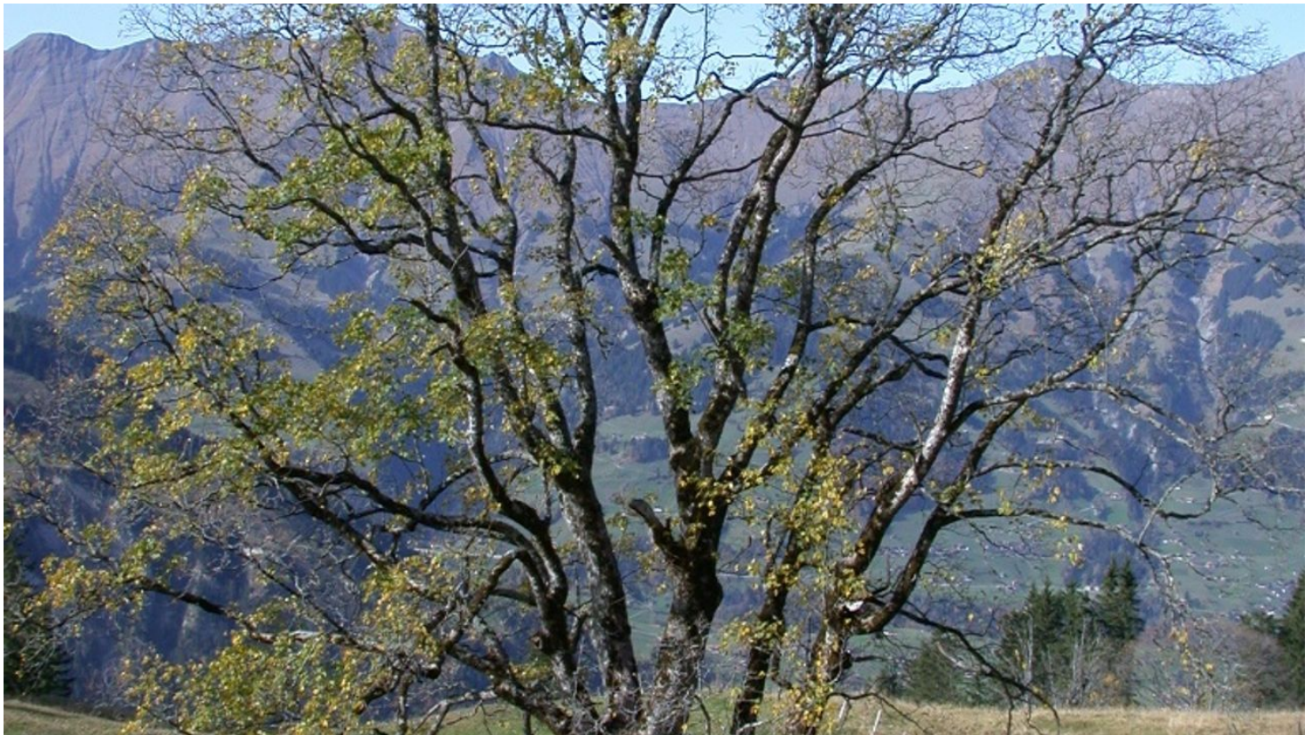
Wanderleiter (ZD) Berner Wanderwege, Berner Wanderwege