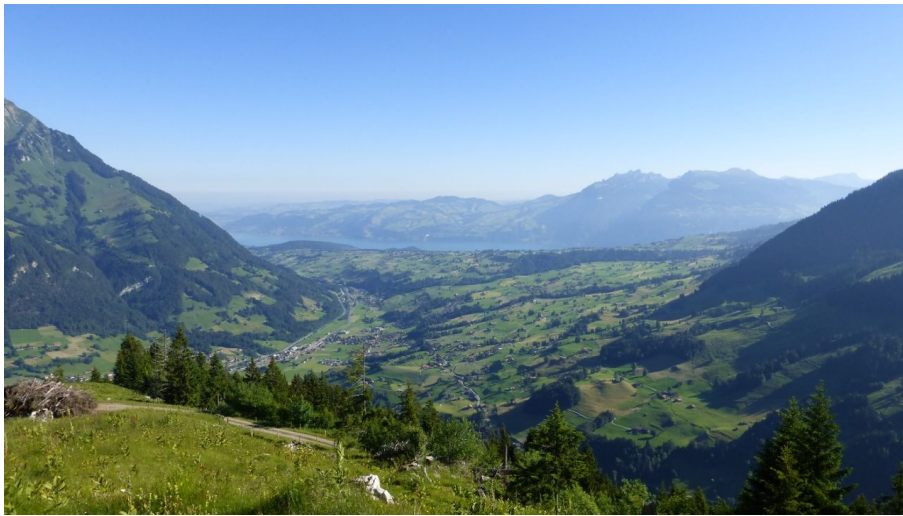
Wanderleiter (ZD) Berner Wanderwege, Berner Wanderwege