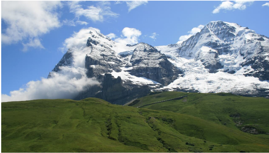
Wanderleiter (ZD) Berner Wanderwege, Berner Wanderwege