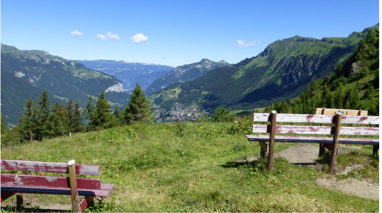
Wanderleiter (ZD) Berner Wanderwege, Berner Wanderwege