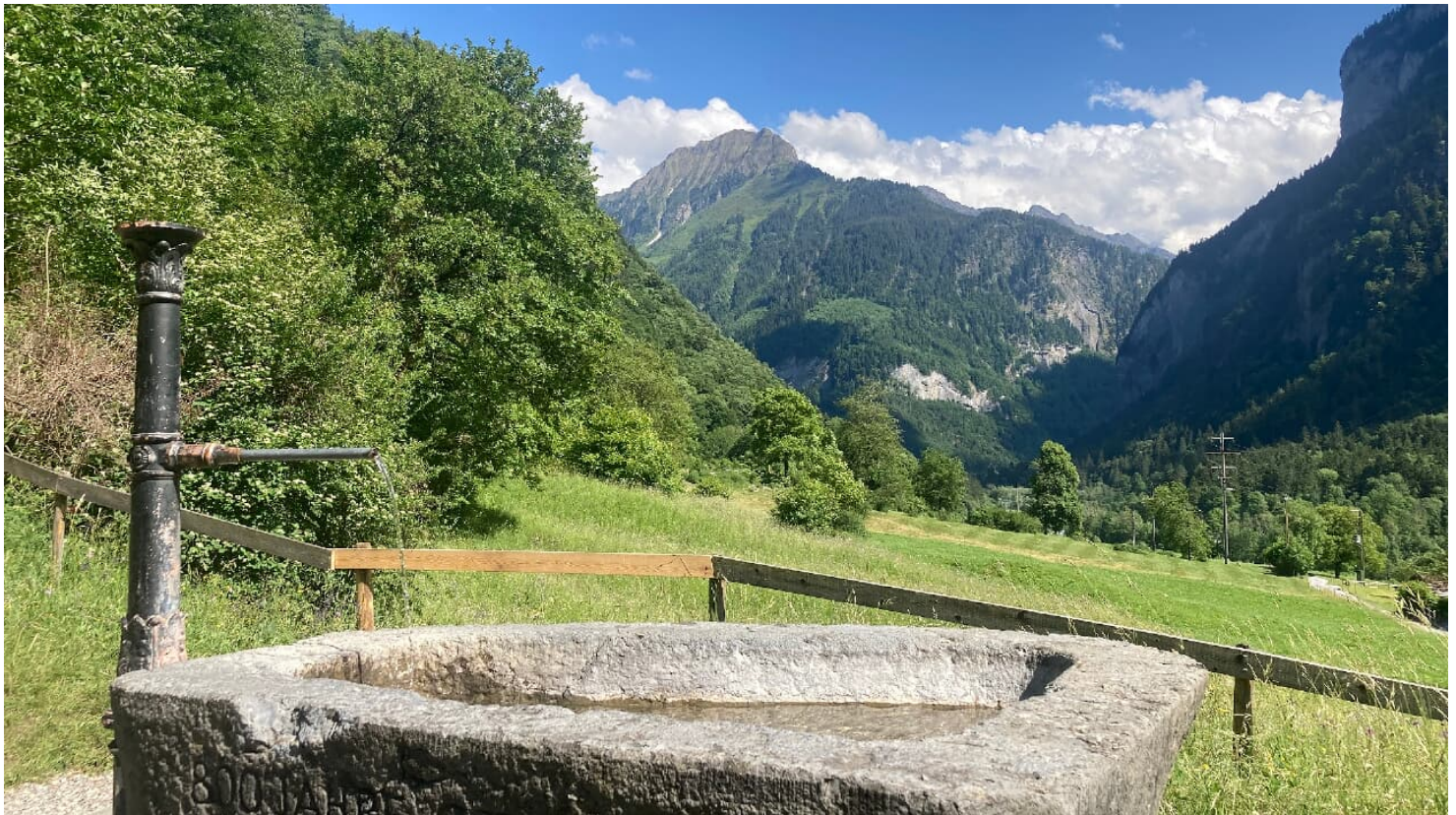
Markus Schluop, Berner Wanderwege