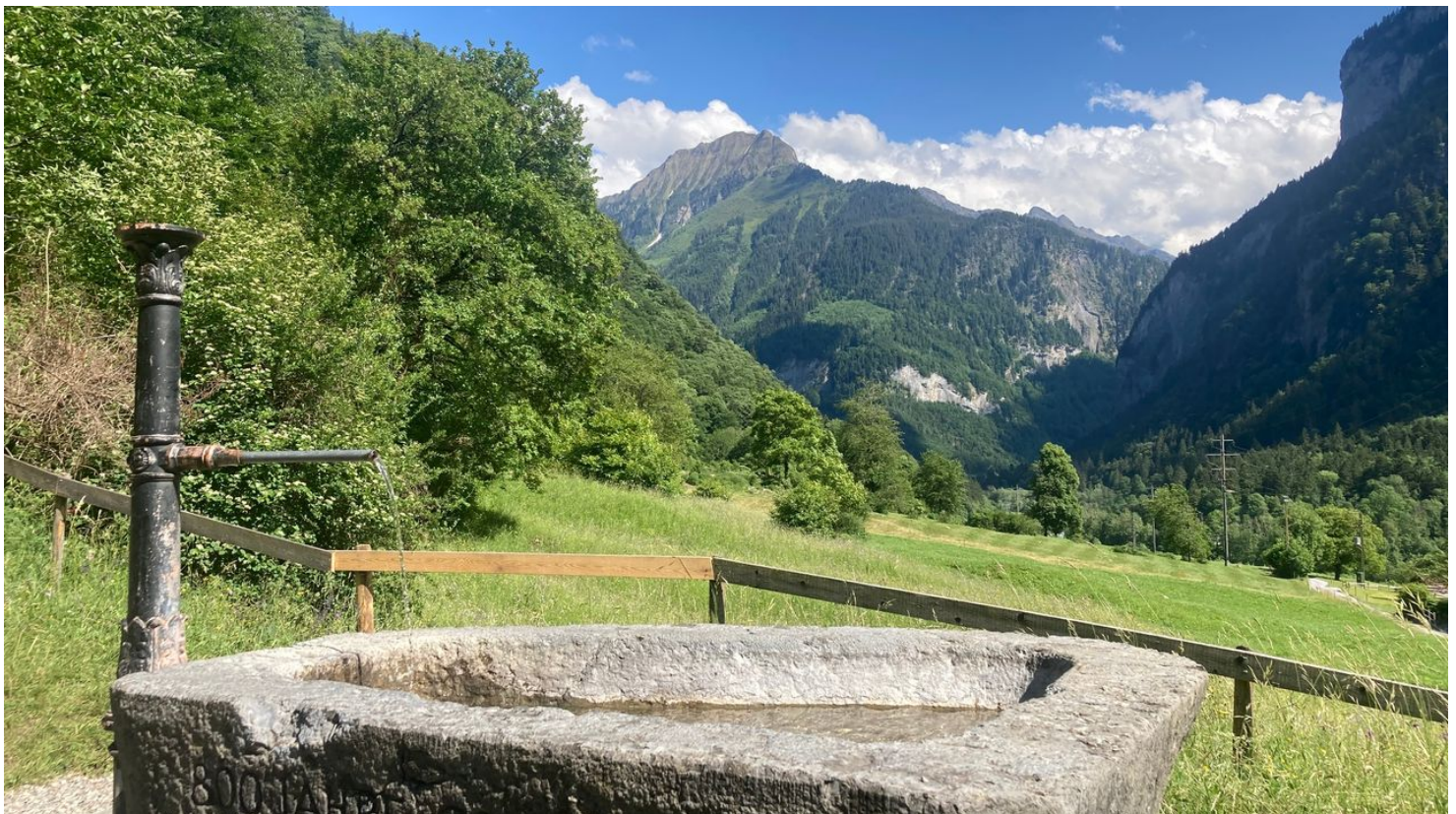
Markus Schlupe, Berner Wanderwege