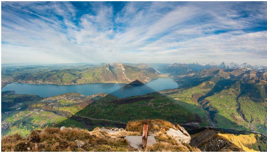
Melanie Studer, Interlaken Tourismus