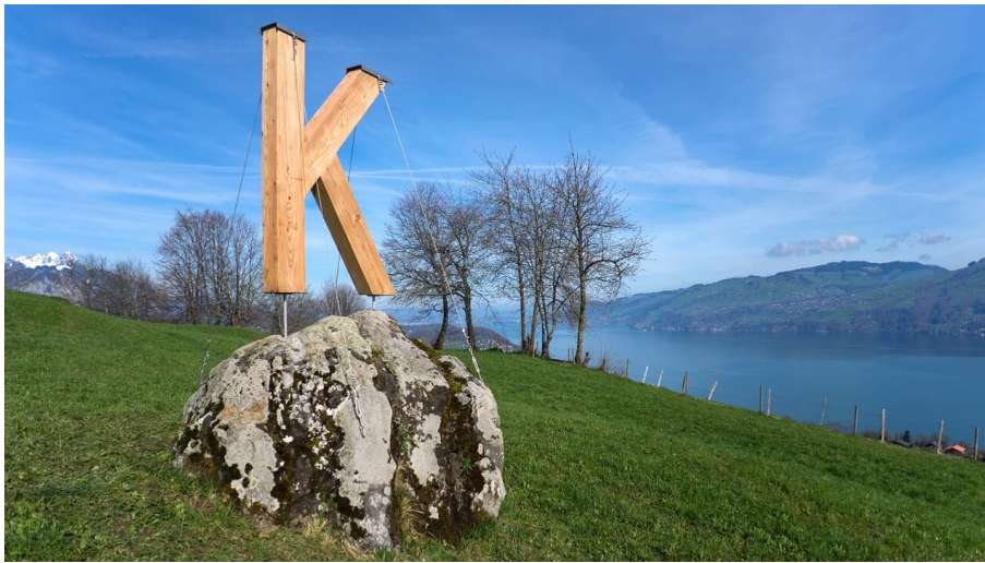
Melanie Studer, Interlaken Tourismus