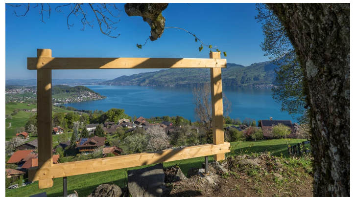
Melanie Studer, Interlaken Tourismus