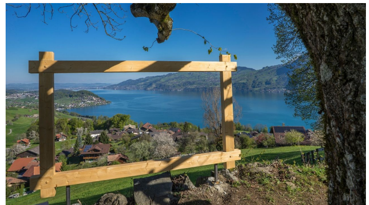
Melanie Studer, Interlaken Tourismus