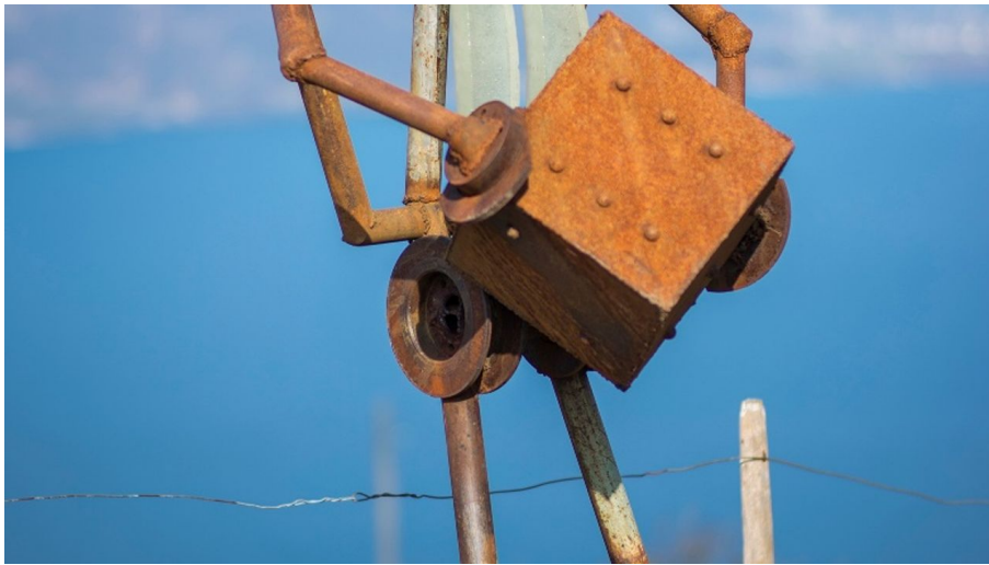
Melanie Studer, Interlaken Tourismus