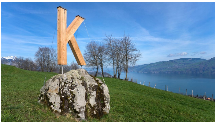
Melanie Studer, Interlaken Tourismus