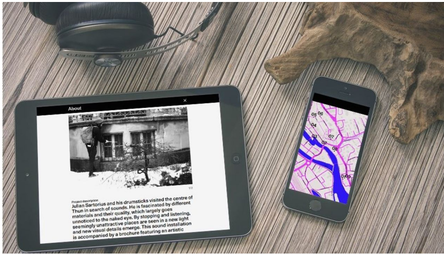
Melanie Studer, Interlaken Tourismus