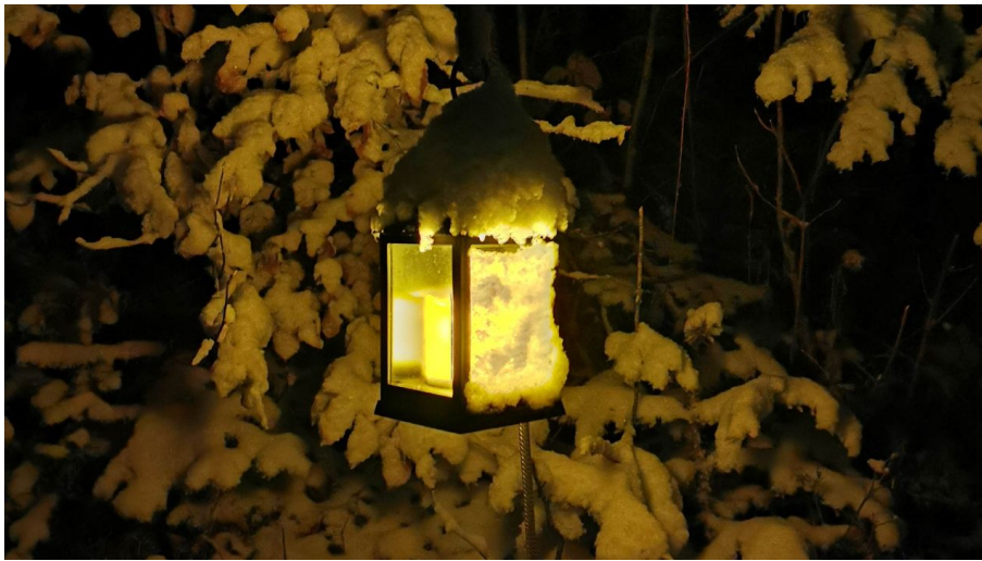
Scheebedeckte Laterne auf dem Weihnachtsweg Heiligenschwendi