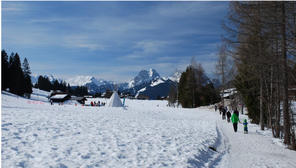
Markus Schlupe, Berner Wanderwege