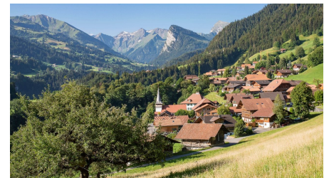
Blick auf Dorf Diemtigen