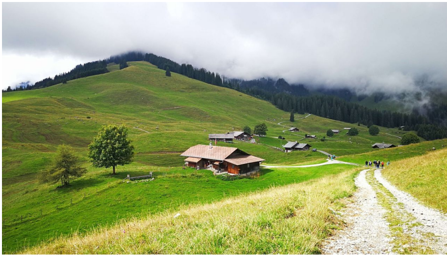
Alp Tschuggen vom Nebel umgeben