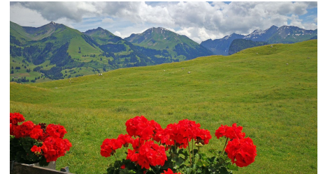
Blick ab Alphütte