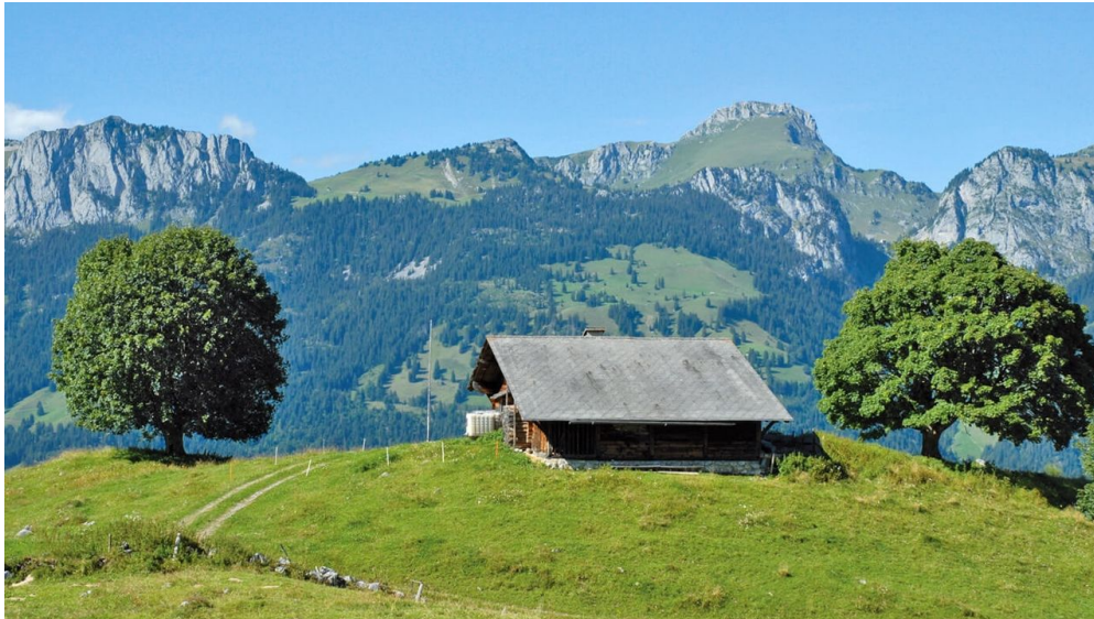
Eine der Alphütten auf Tschuggen