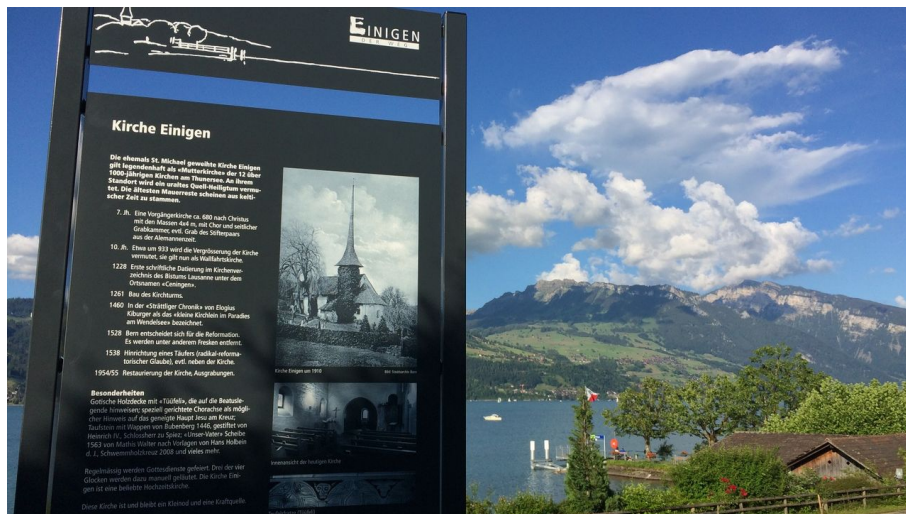
Melanie Studer, Interlaken Tourismus