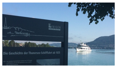
Melanie Studer, Interlaken Tourismus