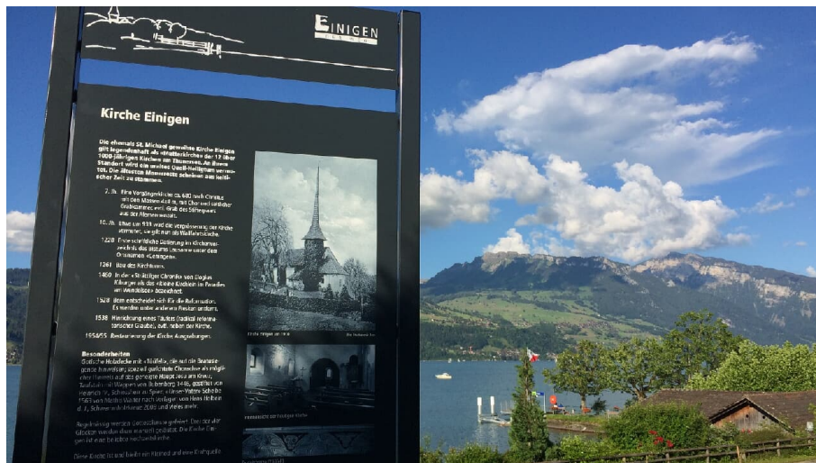
Melanie Studer, Interlaken Tourismus