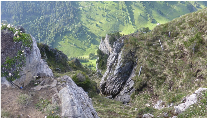
Steil geht es runter ins Justistal