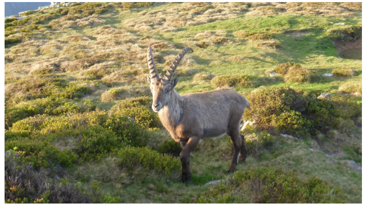
Steinbock auf dem Niederhorn