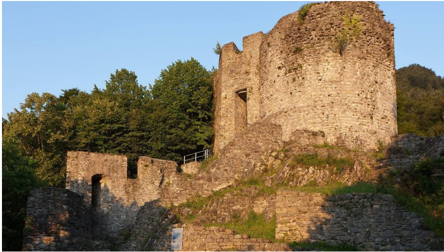
Interlaken Tourismus, Interlaken Tourismus