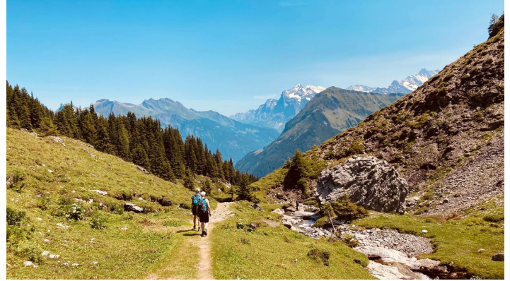
Markus Schlupe, Berner Wanderwege