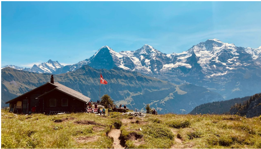
Markus Schlupe, Berner Wanderwege