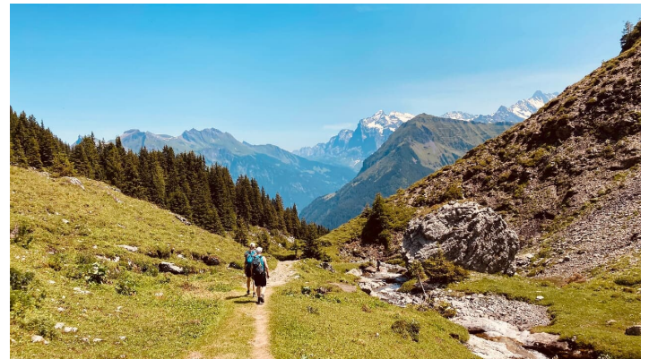
Markus Schlupe, Berner Wanderwege