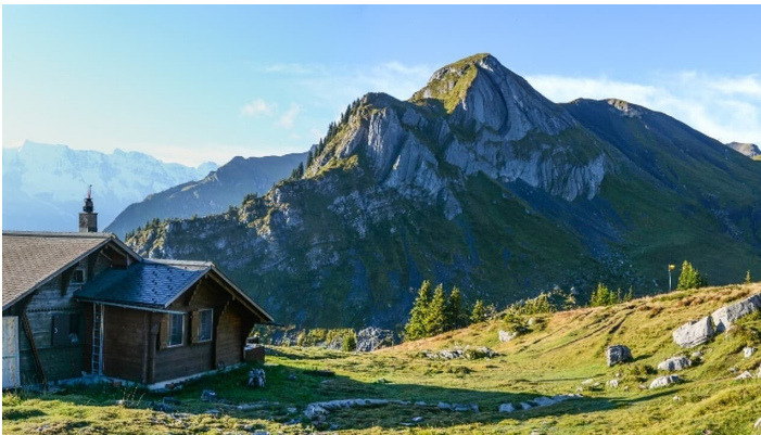
Zivil Dienst, Berner Wanderwege