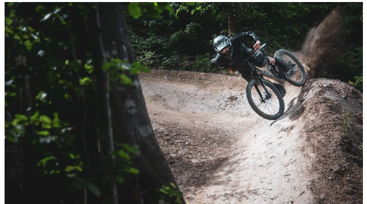
Bikepark Thunersee - © Bikepark Thunersee, Interlaken Tourismus