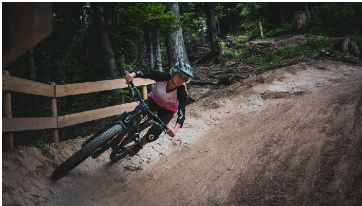
Bikepark Thunersee Downhill