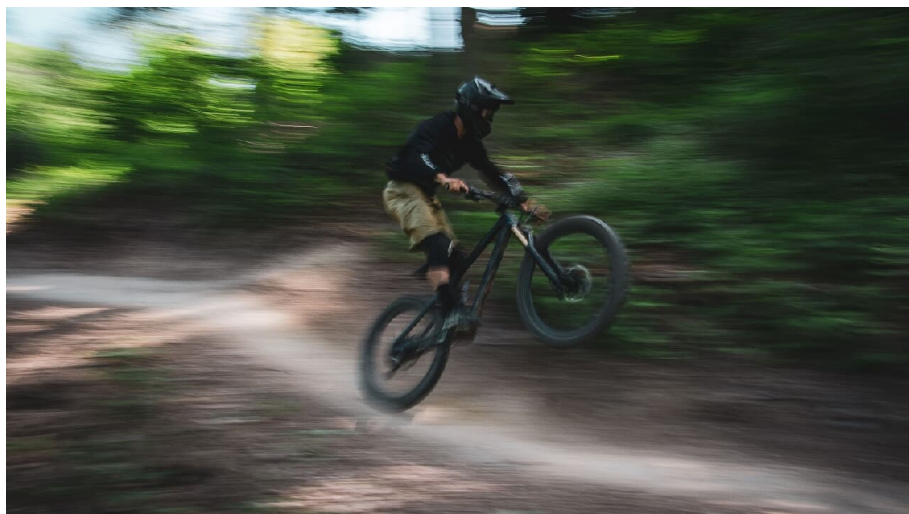
Bikepark Thunersee Downhill - © Bikepark Thunersee, Interlaken Tourismus