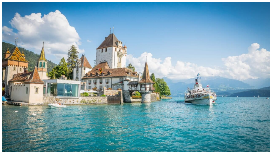
Schloss Oberhofen mit Dampfschiff Blümlisalp, Oberhofen am Thunersee