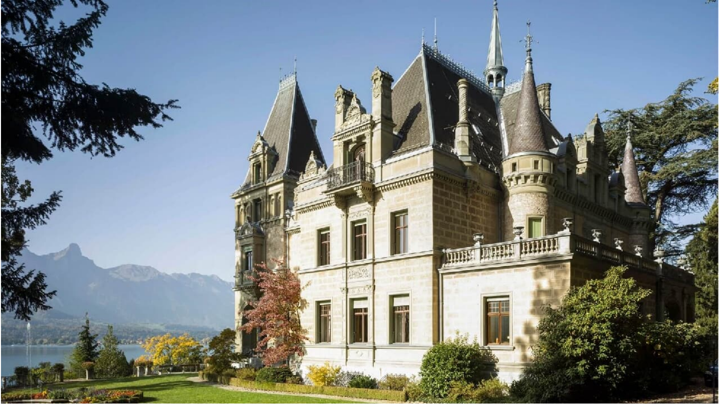
Schloss Hünegg in Hilterfingen am Thunersee