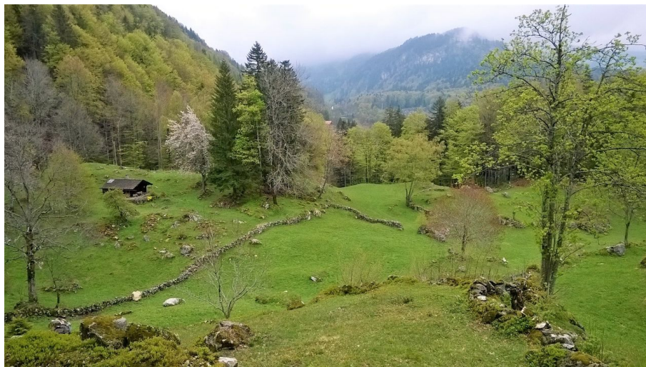
Interlaken Tourismus, Interlaken Tourismus