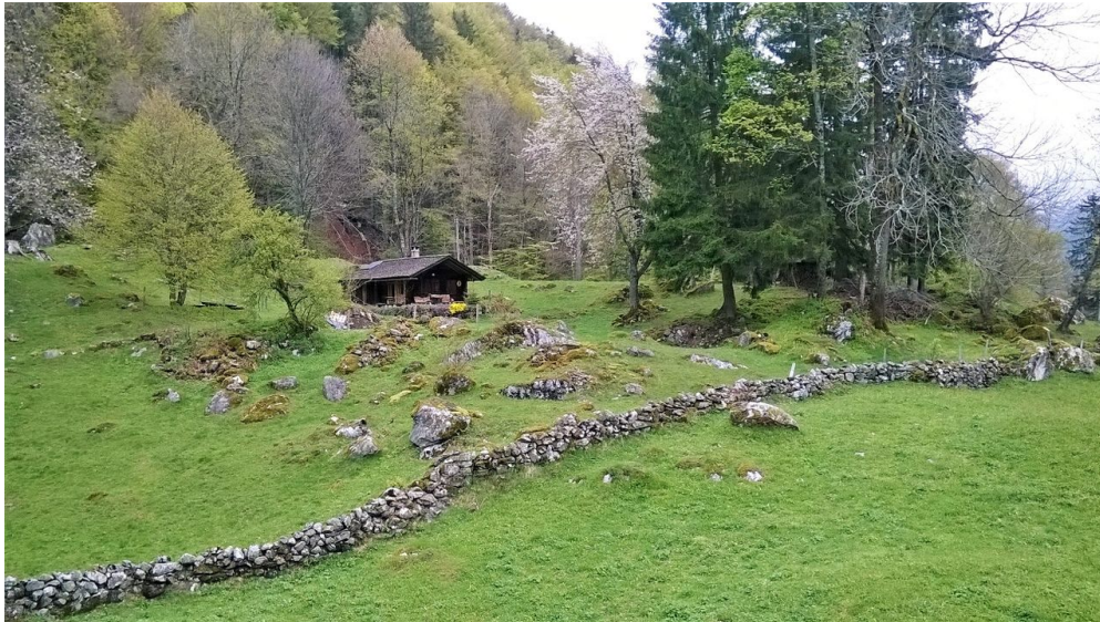
Interlaken Tourismus, Interlaken Tourismus