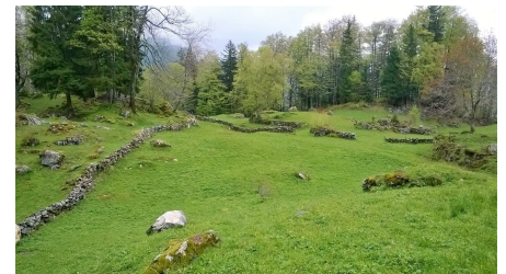
Interlaken Tourismus, Interlaken Tourismus