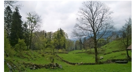
Interlaken Tourismus, Interlaken Tourismus