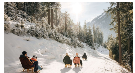
Schlittelspass für die ganze Familie - © Phil Wenger, Wiriehornbahnen