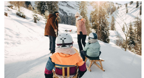
Eltern ziehen ihre Kinder