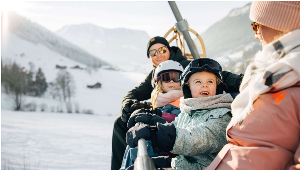
Bequeme Fahrt mit der Sesselbahn