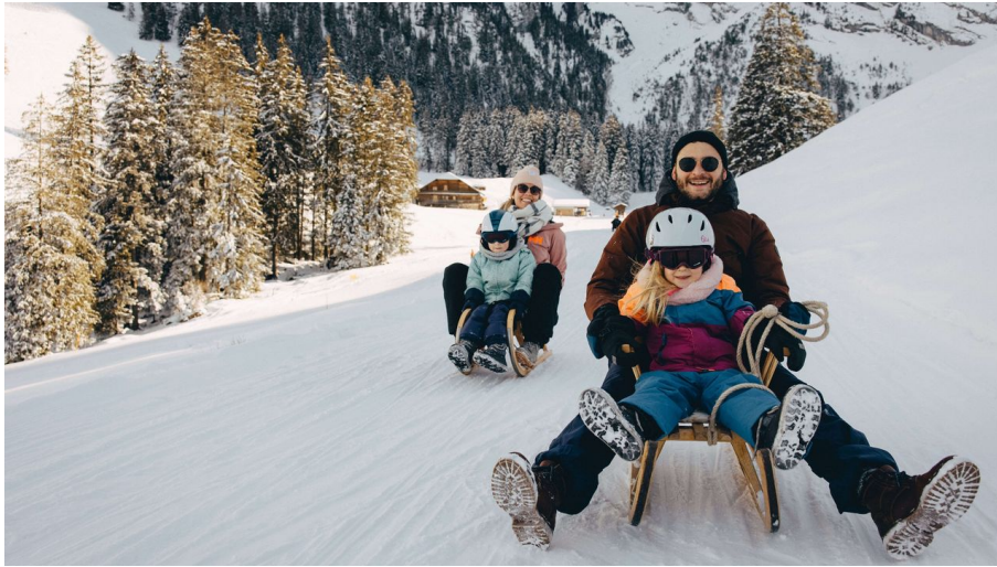
Familien auf Schiltten am Wiriehorn