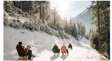
Schlittelspass für die ganze Familie - © Rahel Mazenauer, Naturpark Diemtigtal