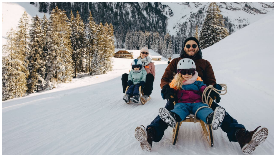
Familien auf Schiltten am Wiriehorn