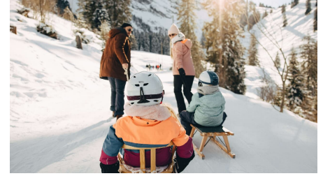
Eltern ziehen ihre Kinder