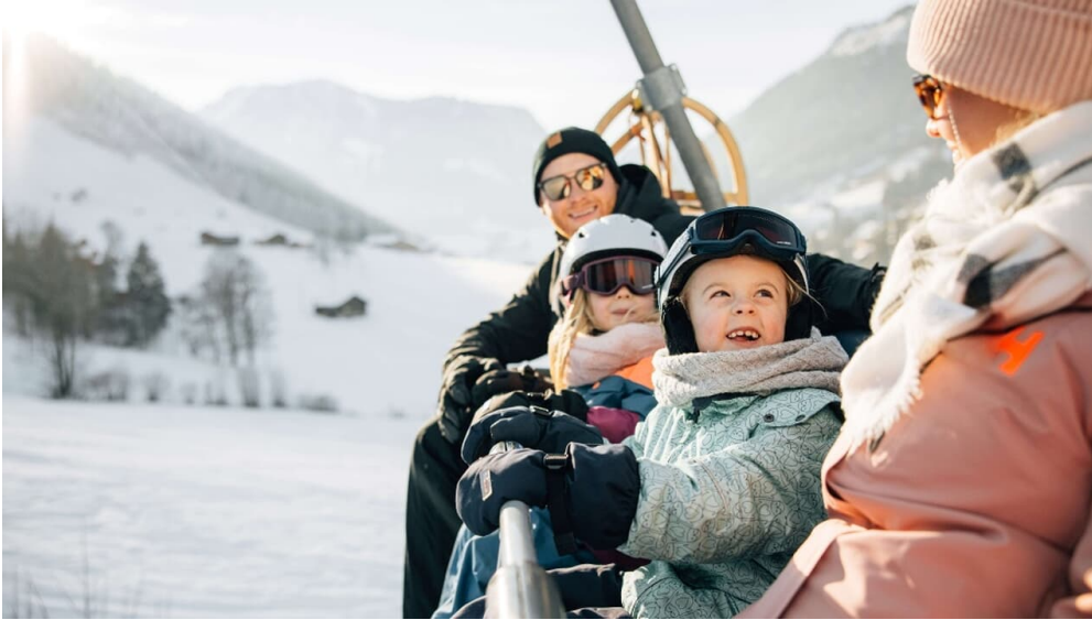
Bequeme Fahrt mit der Sesselbahn