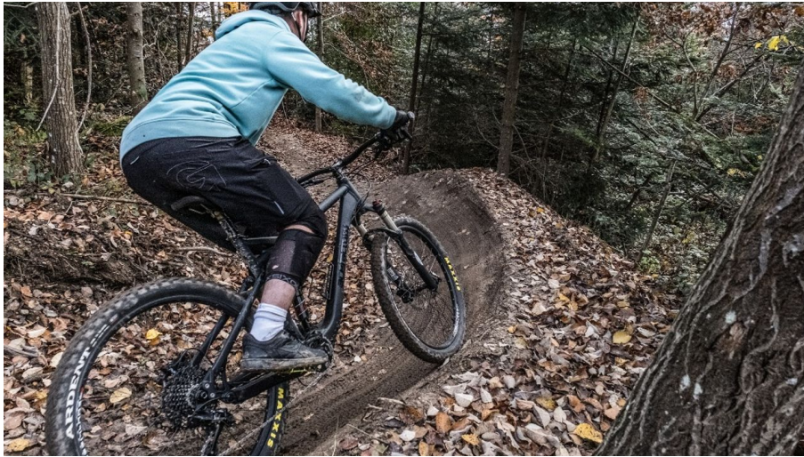
Linkskurve im Wald.