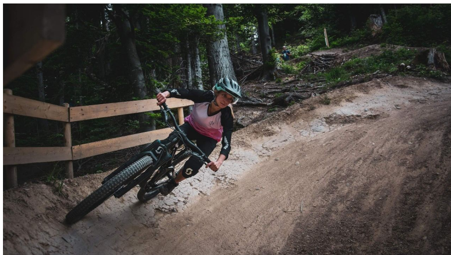
bikepark-thunersee-downhill-wald-kurve-zaun