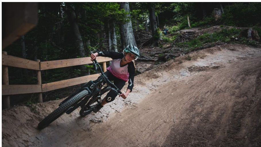
bikepark-thunersee-downhill-wald-kurve-zaun