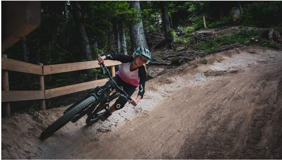
bikepark-thunersee-downhill-wald-kurve-zaun