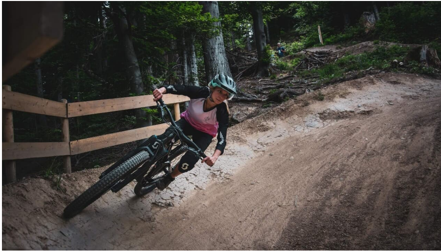
bikepark-thunersee-downhill-wald-kurve-zaun