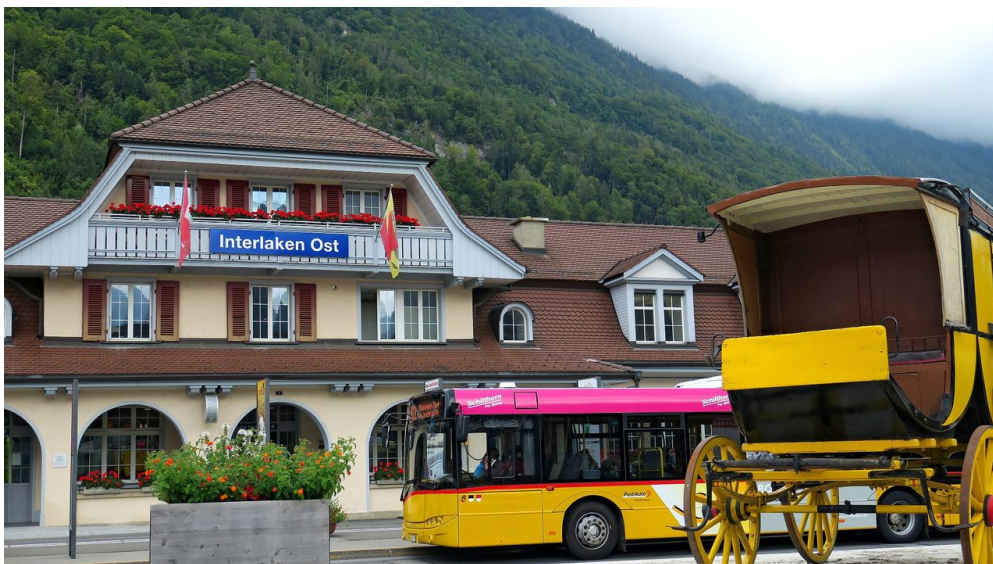
Bahnhof Interlaken Ost.