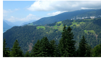
Blick von der Hardermatte nach Beatenberg.