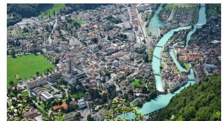
Tiefblick auf Interlaken und Aare.