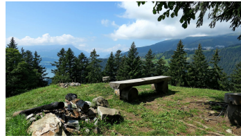
Hardermatte. - © Jochen Ihle, Tourenplaner SCHWEIZ