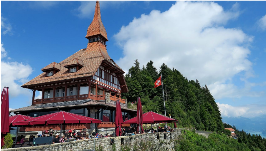
Panorama-Restaurant Harder Kulm. - © Jochen Ihle, Tourenplaner SCHWEIZ