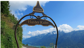
Harder Kulm. - © Jochen Ihle, Tourenplaner SCHWEIZ