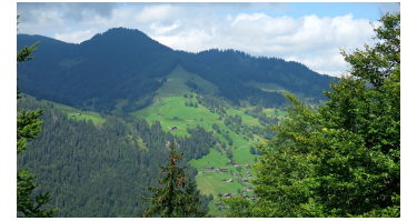
Habkern. - © Jochen Ihle, Tourenplaner SCHWEIZ