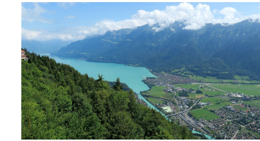
Blick vom Harder Kulm zum Brienzersee.