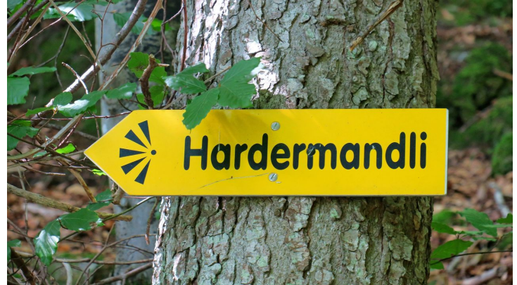
Aussichtspunkt Hardermandli.