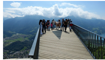
Zwei-Seen-Steg auf dem Harder Kulm.