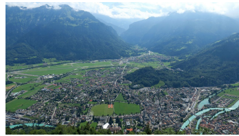
Blick vom Harder Kulm auf Interlaken.