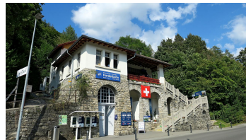
Talstation Harderbahn.