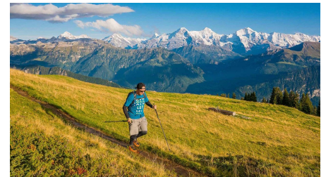
Trailrunner unterwegs Beatenberg, im Hintergrund die das Dreigestirn Eiger, Mönch und Jungfrau