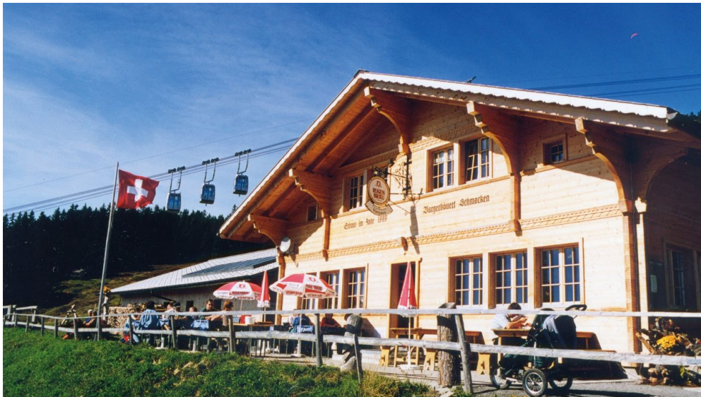
vorsass-aussenbereich