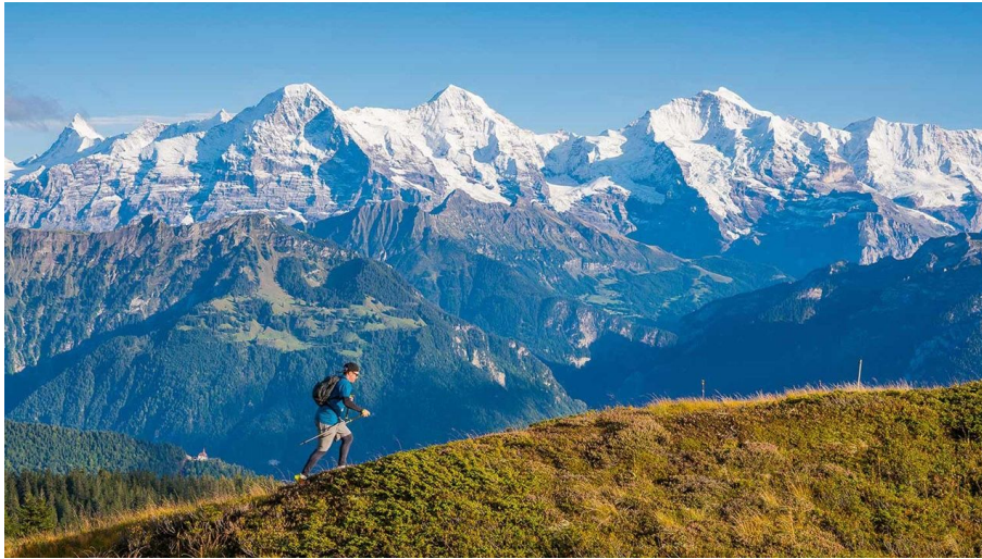
Trailrunner oberhalb Beatenberg vor der eindrücklichen Bergkulisse mit Eiger, Mönch und Jungfrau