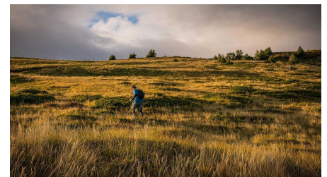
Trailrunner unterwegs bergauf oberhalb Beatenberg