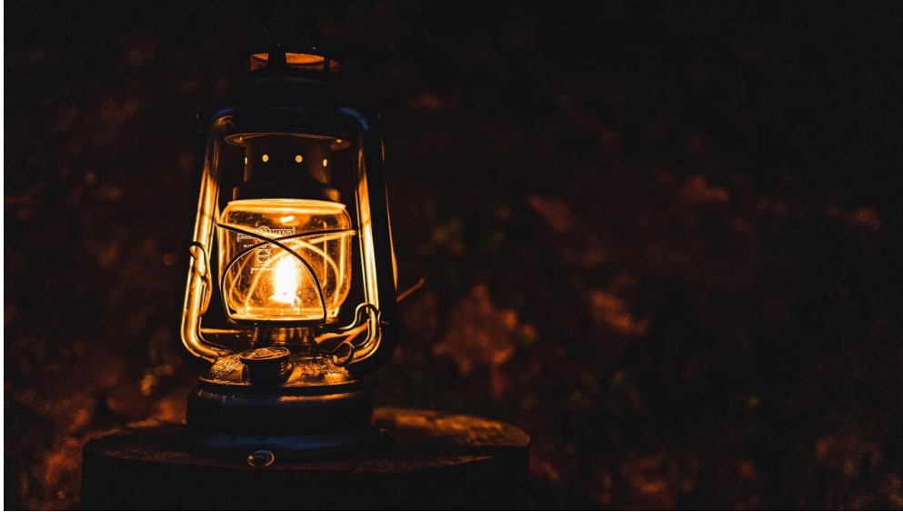
Brennende Laterne auf dem Laternenweg Meielsalp - © Meielsalp, Interlaken Tourismus