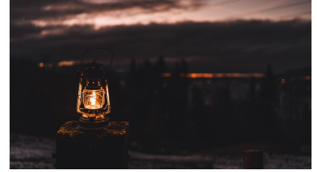
Laternenlicht bei der Abenddämmerung