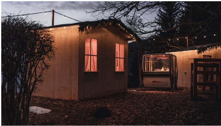
Beleuchtetes Fondue-Chalet und Gondel im Winterdorf Meielsalp