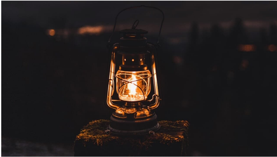
Laterne auf dem Laternenweg Meielisalp