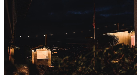
Winterdorf Meielsalp bei Nacht