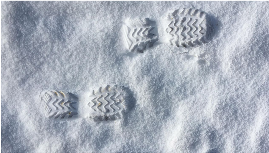
Spuren im Schnee