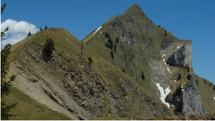
Berne Rando, Berner Wanderwege