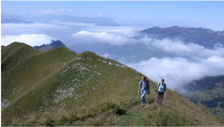
Berne Rando, Berner Wanderwege