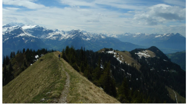
Berne Rando, Berner Wanderwege