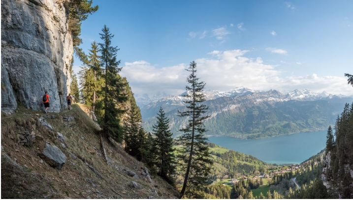
Berne Rando, Berner Wanderwege