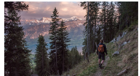
Berne Rando, Berner Wanderwege