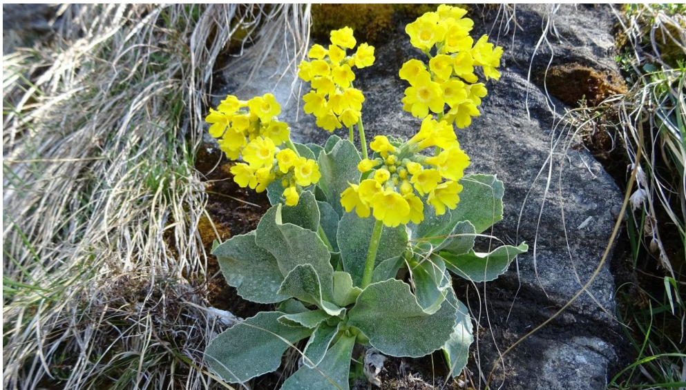
Blühende Aurikel