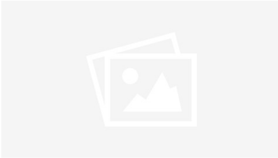
Gasse mit alten Häusern in Brienzwiler