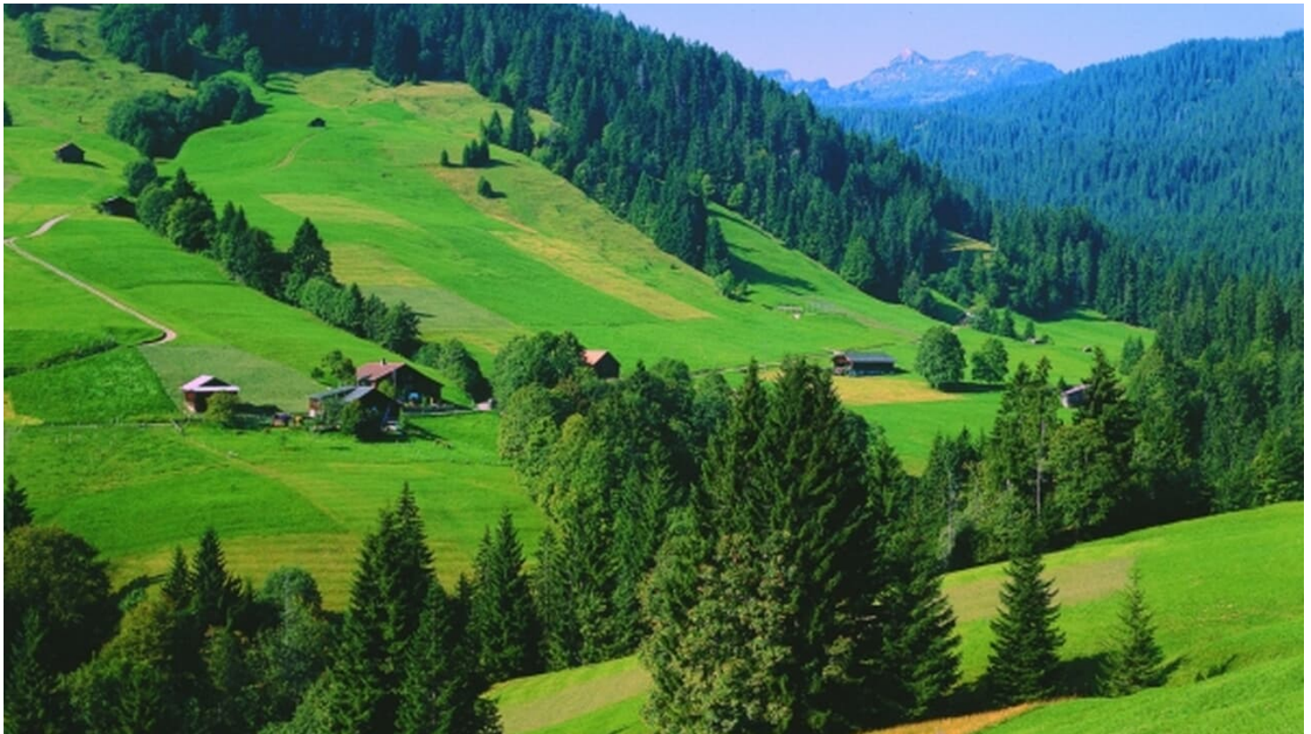
Berner Wanderwege, Berner Wanderwege