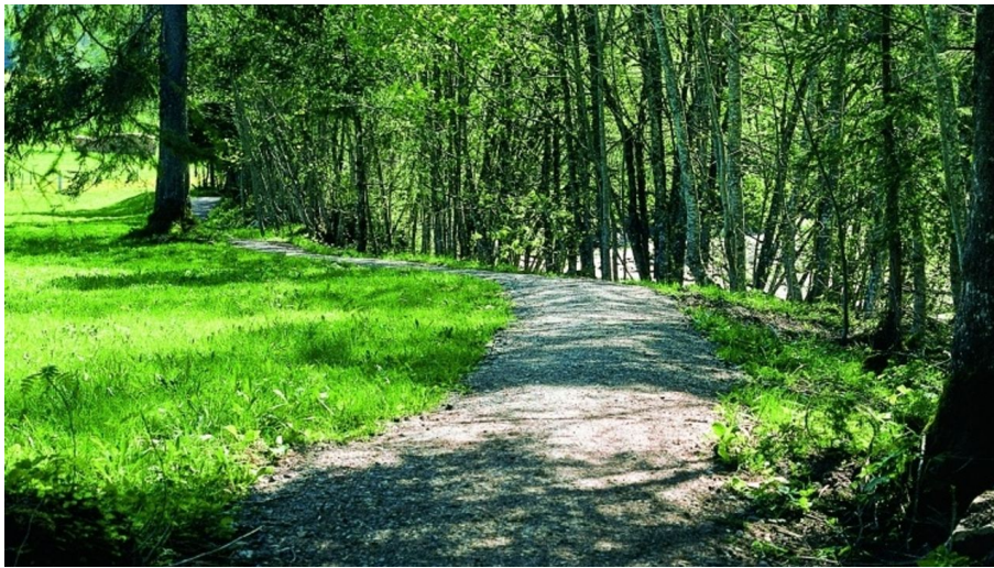
Berner Wanderwege, Berner Wanderwege