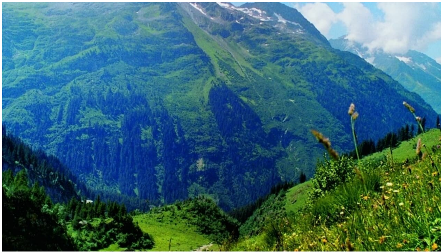
Berner Wanderwege, Berner Wanderwege