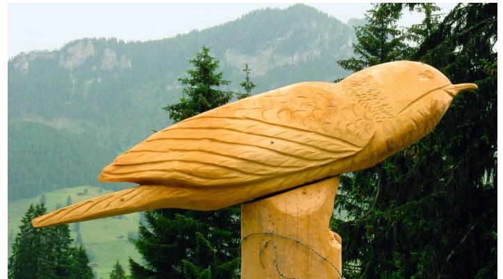
Berner Wanderwege, Berner Wanderwege