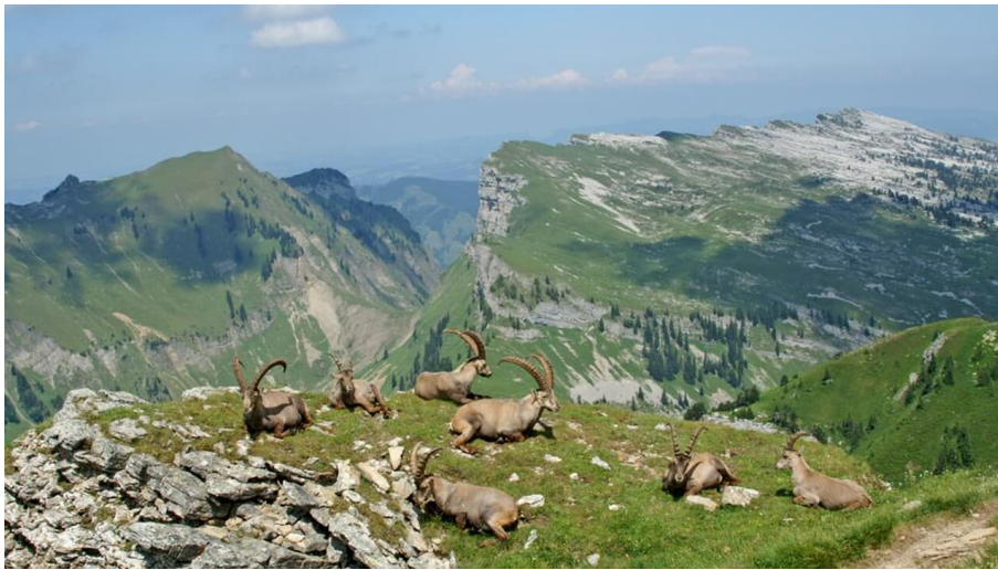
Berner Wanderwege, Berner Wanderwege