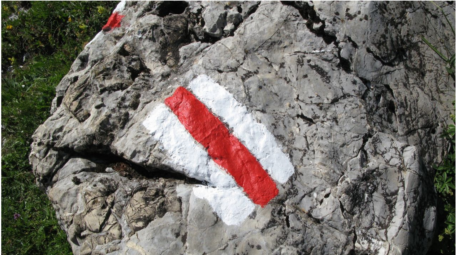
Berner Wanderwege, Berner Wanderwege