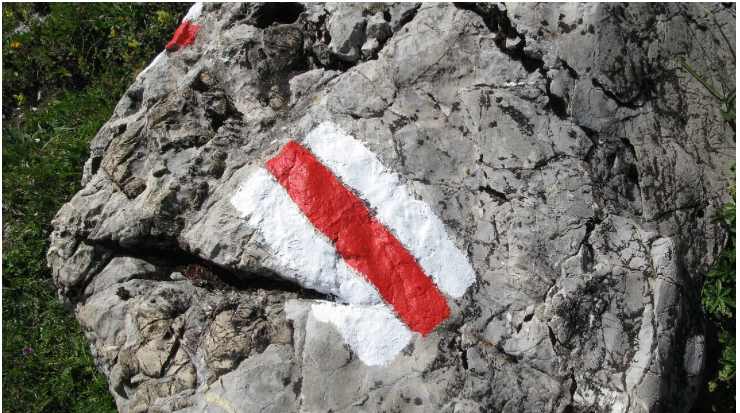
Berner Wanderwege, Berner Wanderwege