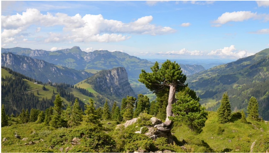
Naturpark Diemtigtal, Unbekannt