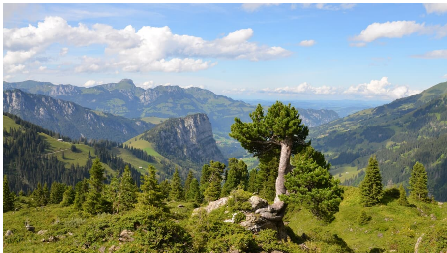
Naturpark Diemtigtal, Inconnu