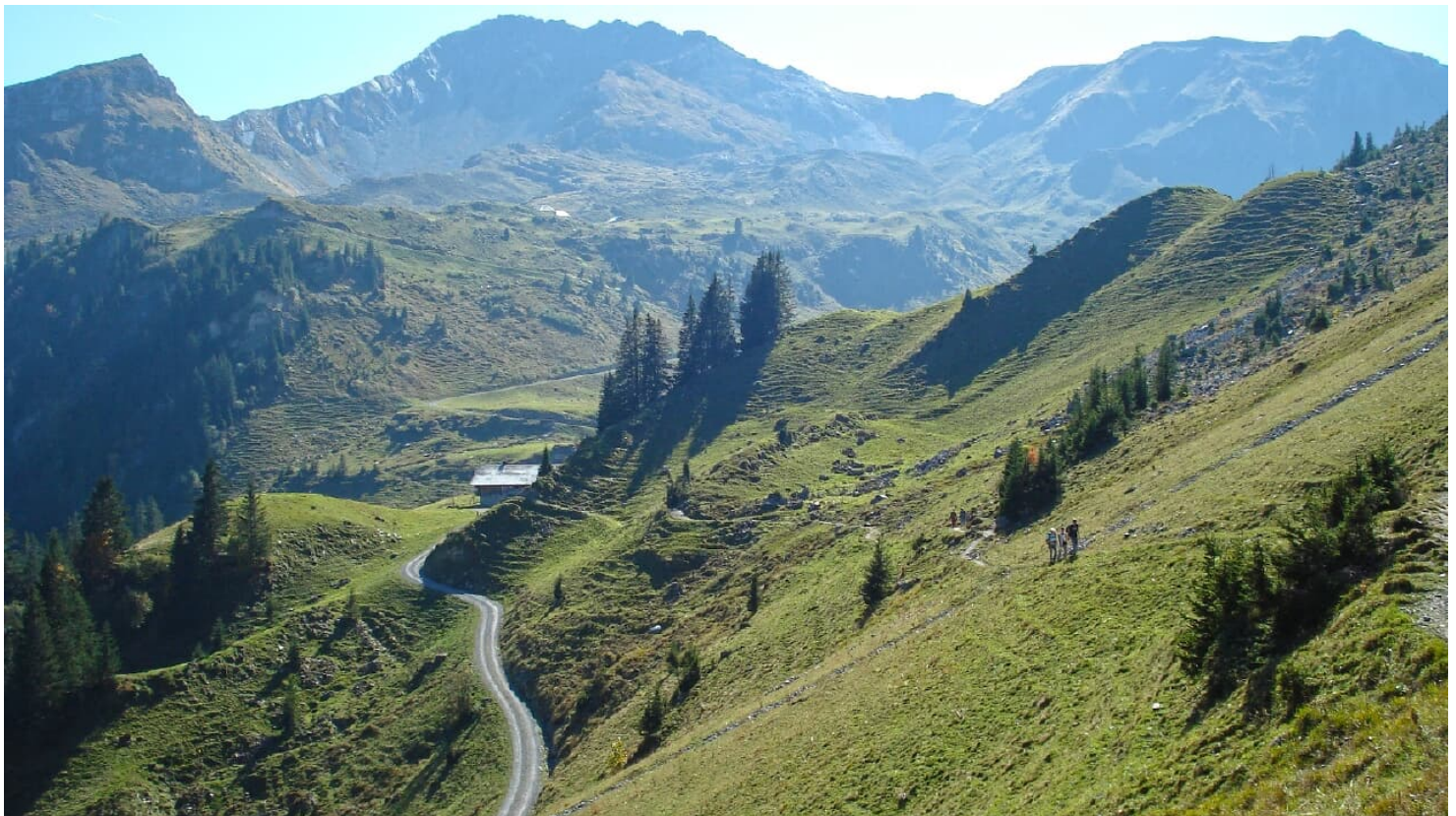
Naturpark Diemtigtal, Inconnu