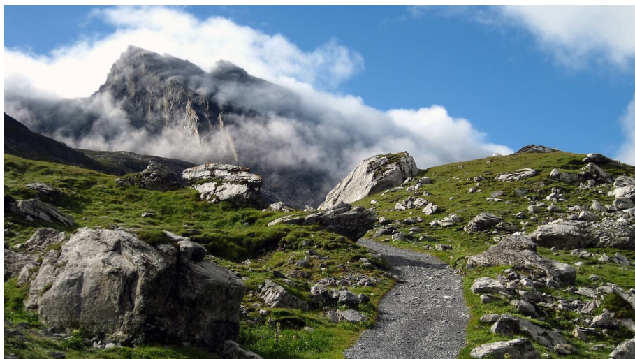
Berner Wanderwege, Berner Wanderwege