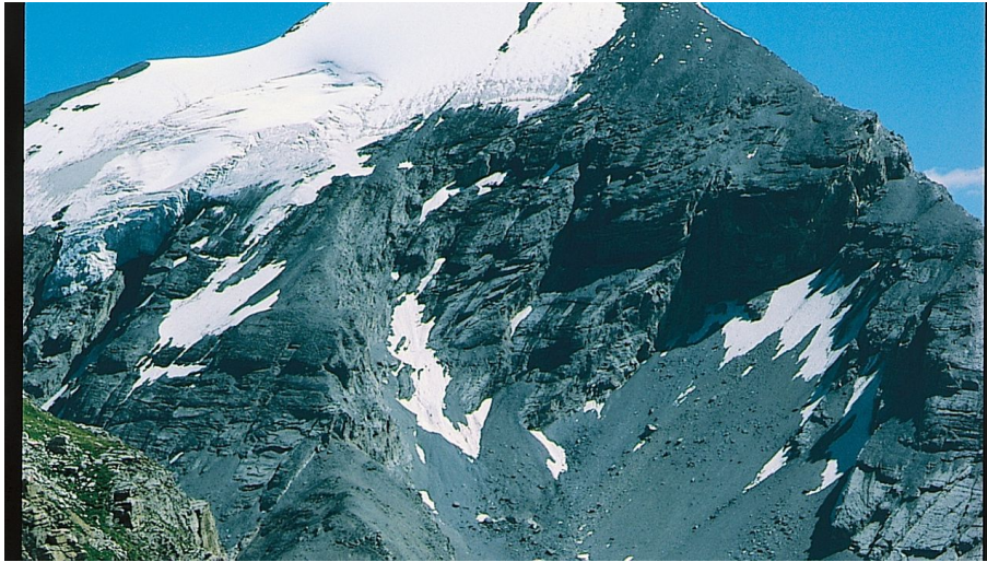
Ins Reich