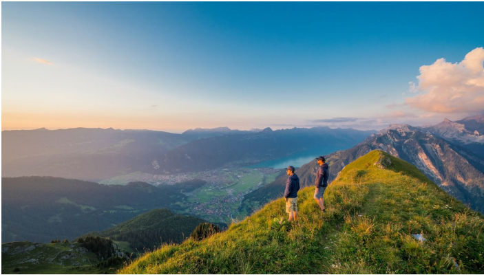
Bällenhöchst Gipfelfoto - © Mike Kaufmann, Interlaken Tourismus