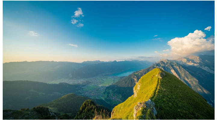
Bällenhöchst Gipfelfoto