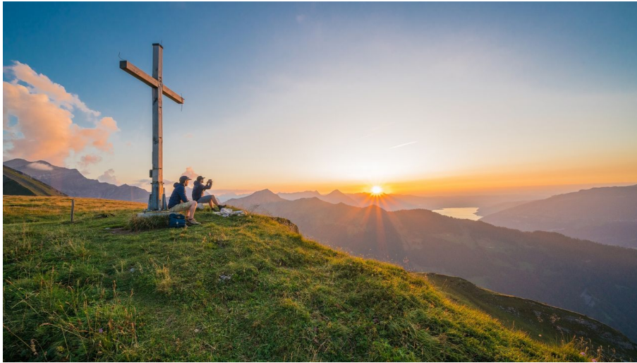
Bällehöchst Gipfelfoto