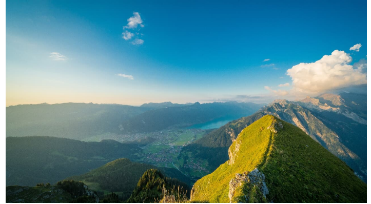
Bällenhöchst Gipfelfoto