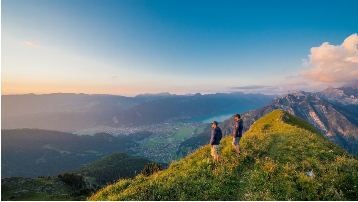
Bällenhöchst Gipfelfoto