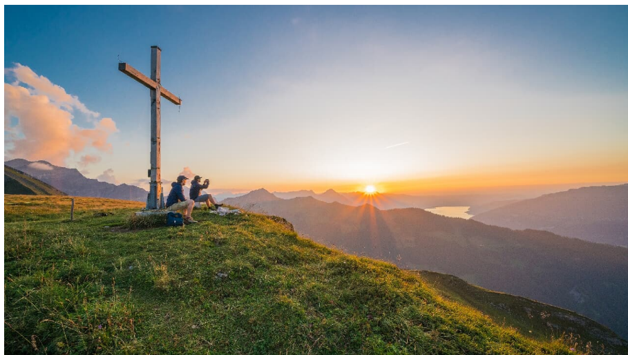
Bällehöchst Gipfelfoto